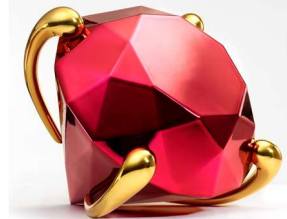
Ai Weiwei, Ossip Zadkine, Banksy, Auguste Rodin, Jeff Koons, Ferdinand Leger, David Cerný, Vincent van Gogh