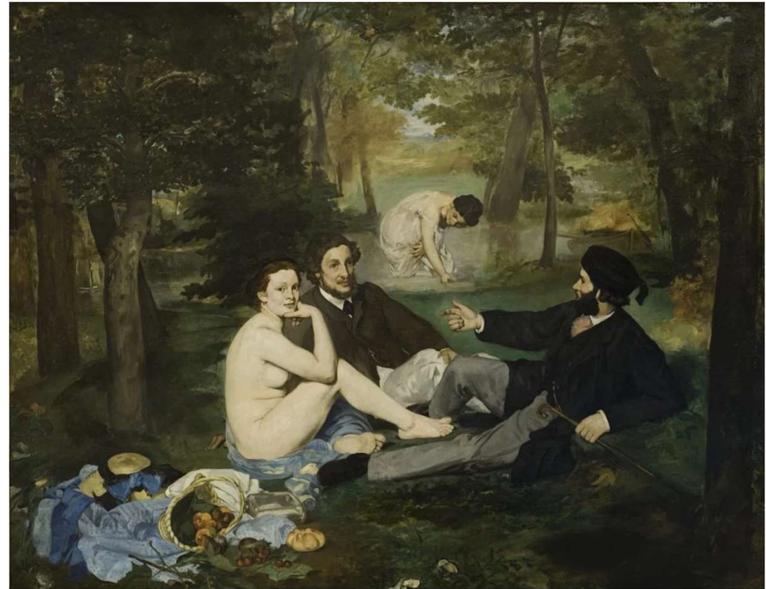
Édouard Manet, Le Déjeuner sur l'herbe . 1863