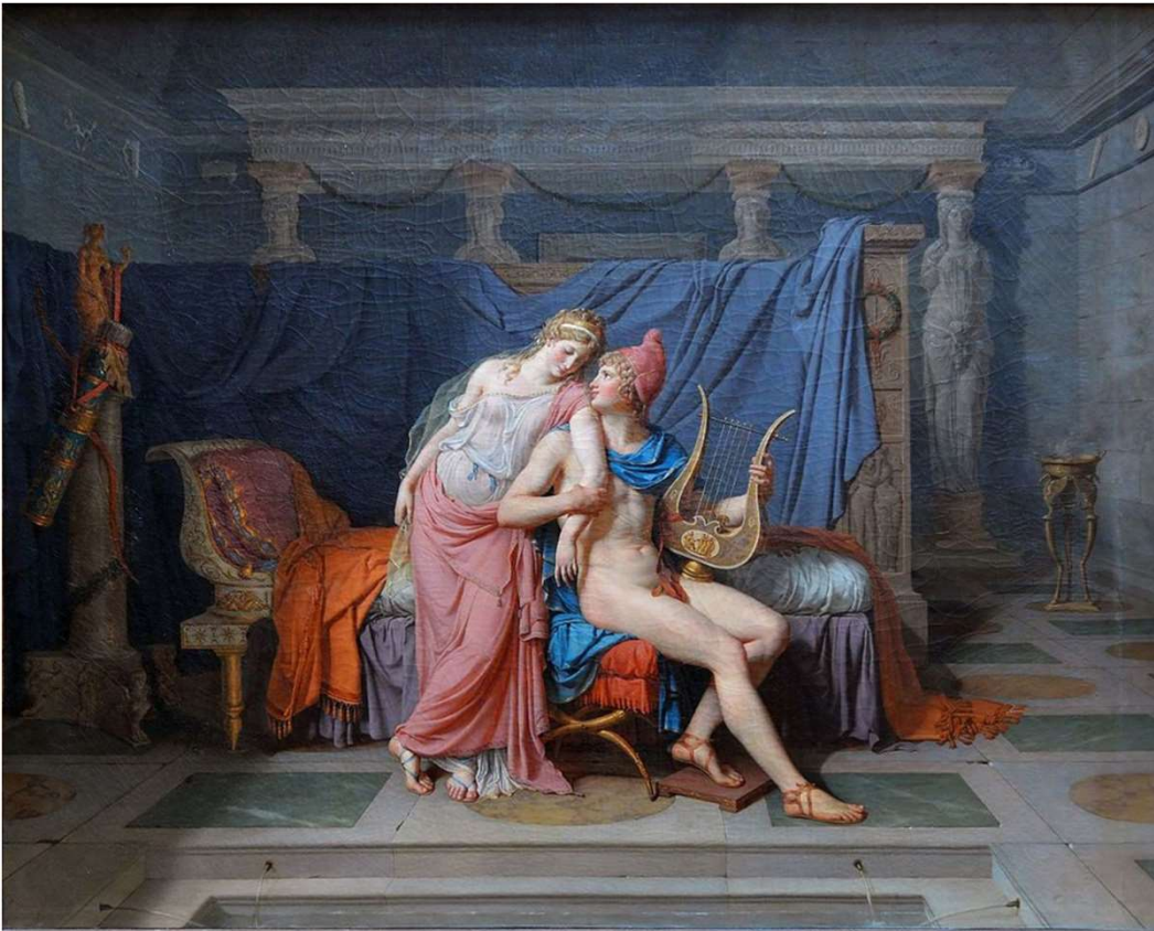
Jacques-Louis David, The Loves of Paris and Helen , 1789