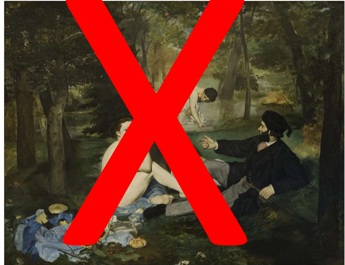
Édouard Manet, Le Déjeuner sur l'herbe . 1863