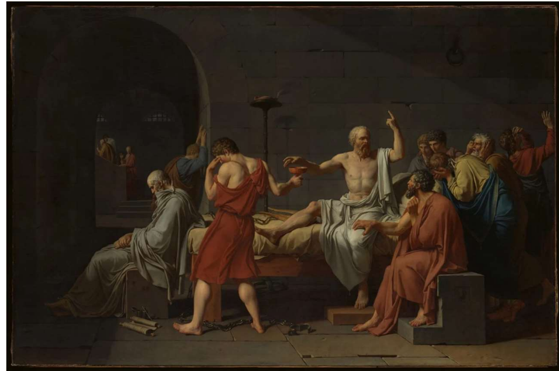
Pierre-Auguste Renoir, "The Luncheon of the Boating Party," 1880-1881 Jacques-Louis David, The Death of Socrates, 1787