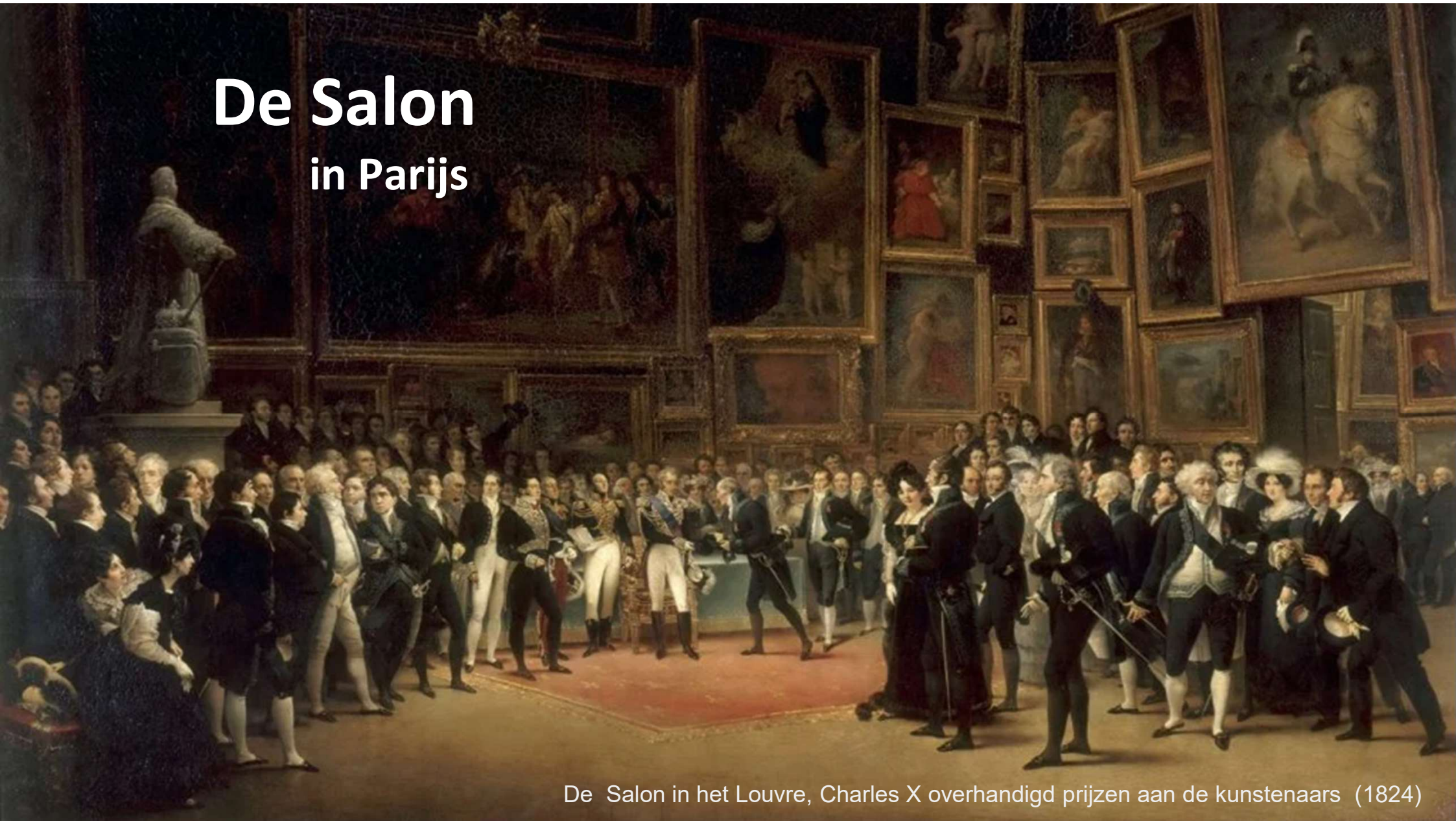
De Salon in het Louvre, Charles X overhandigd prijzen aan de kunstenaars (1824)