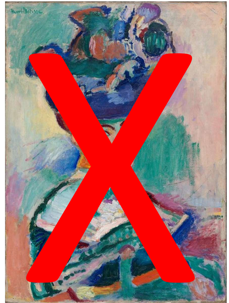
Elizabeth Gardner Bouguereau, The Farmer's Daughter , 1887 Henri Matisse, Woman with a Hat , 1905