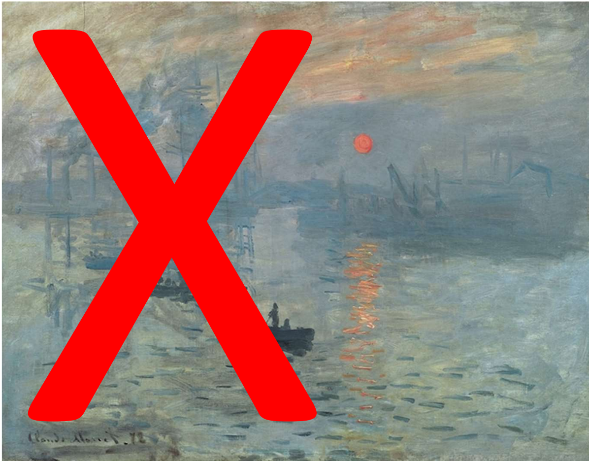
Claude Monet, 'Impression Sunrise,' 1872