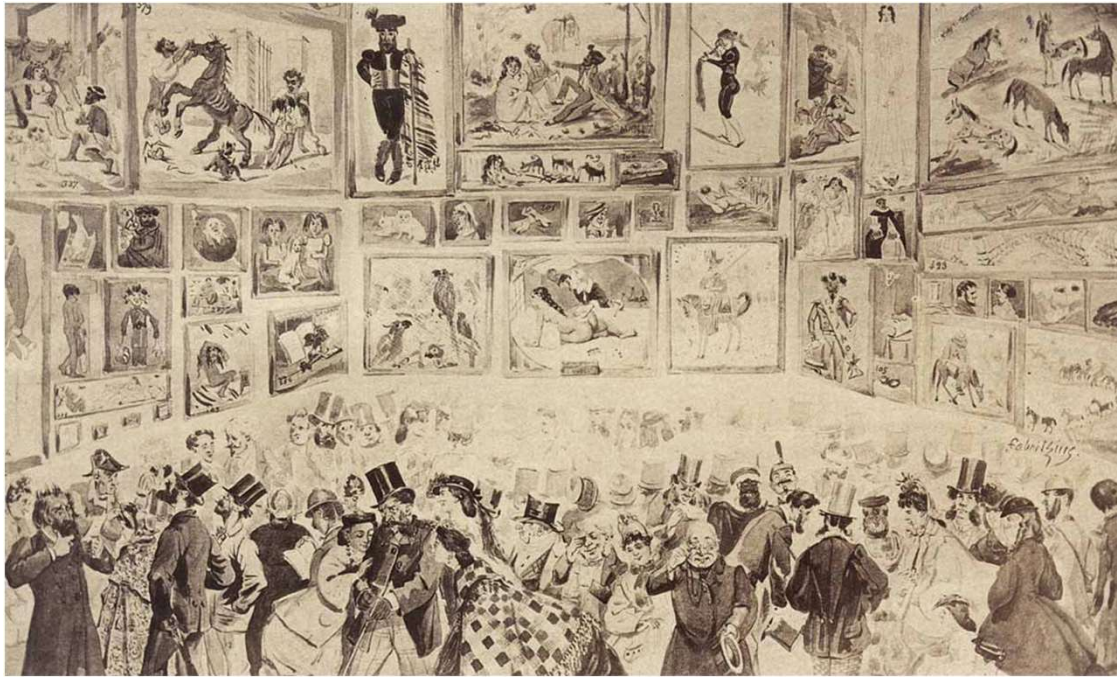
Fabritzius., Caricature view of the Salon des Refusés, 1863

De Salon des Refusés (letterlijk de "Salon van de Afgewezenen") werd in 1863 in Parijs georganiseerd en was bedoeld om een plek te bieden aan kunstenaars wiens werken niet aan de conservatieve normen van de officiële Salon voldeden..