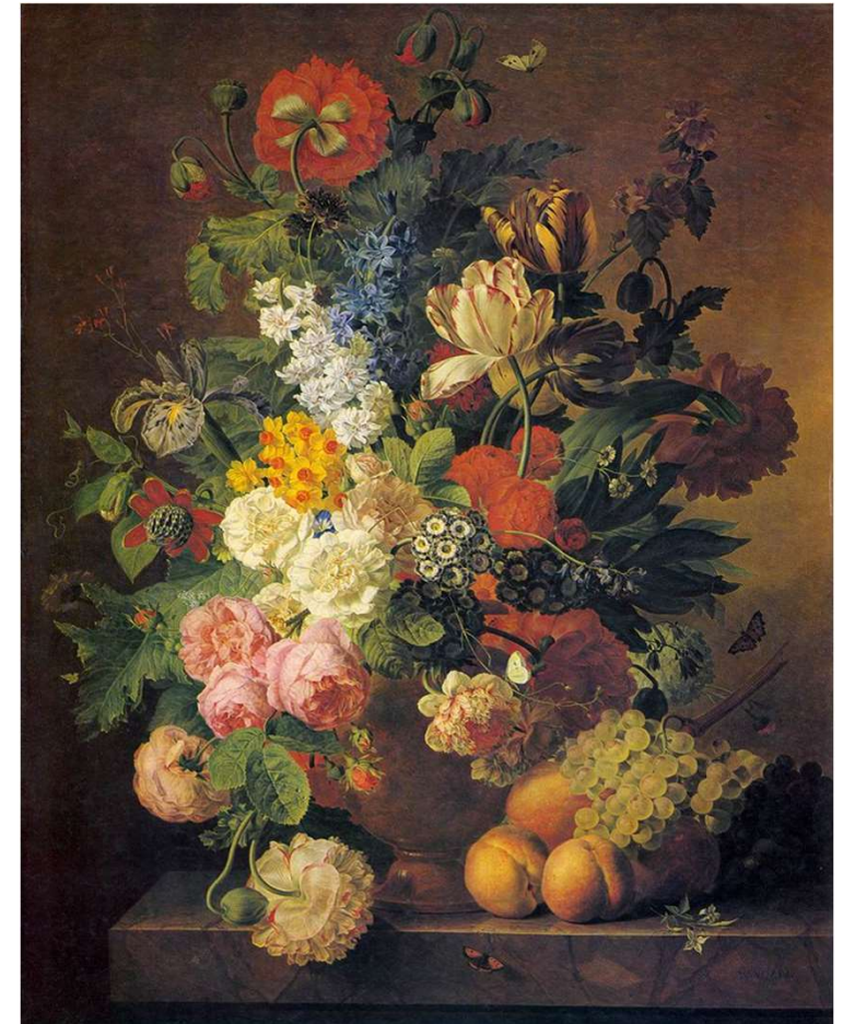
Jan Frans van Dael, Flowers and fruits, 1810