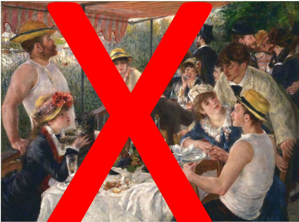
Pierre-Auguste Renoir, "The Luncheon of the Boating Party," 1880-1881