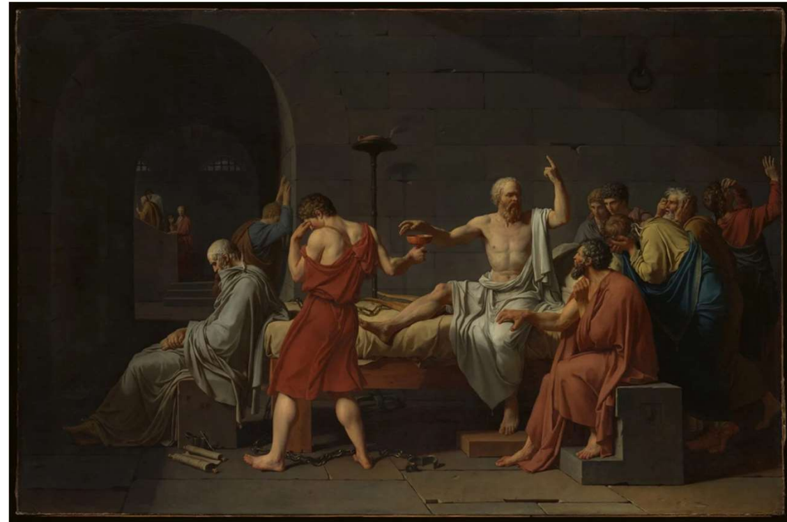
Jacques-Louis David, The Death of Socrates, 1787